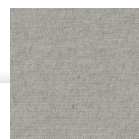
JR4 : GRAFITO