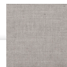
JR5 : NATUREL