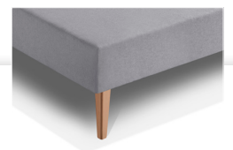
Finition Coiffe 4 coins