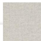
JR3 : CENIZA